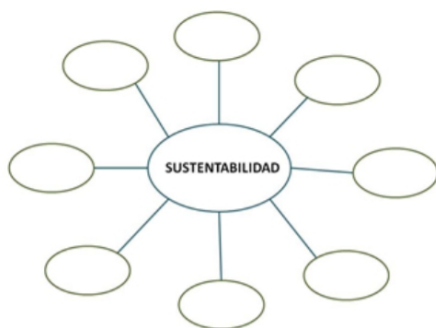
Figura 14 Formato de mapa cognitivo propuesto.