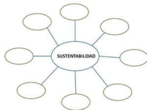
Figura 14 Formato de mapa cognitivo propuesto.