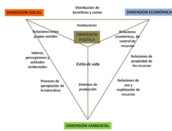
Figura 11 Las dimensiones de la sustentabilidad (a partir de Achkar 2005).

b. En un breve texto justifica tu elección: