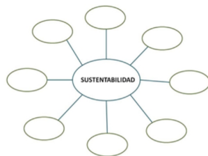
Figura 14 Formato de mapa cognitivo propuesto.