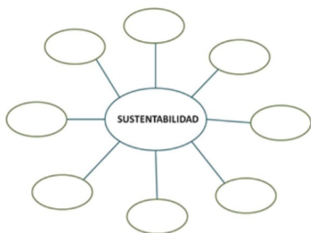
Figura 14 Formato de mapa cognitivo propuesto.